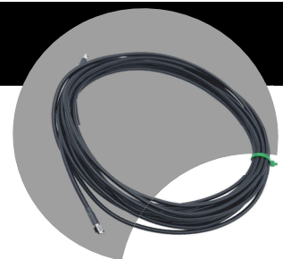
Prolongamento de cabo de 10 m (opcional)