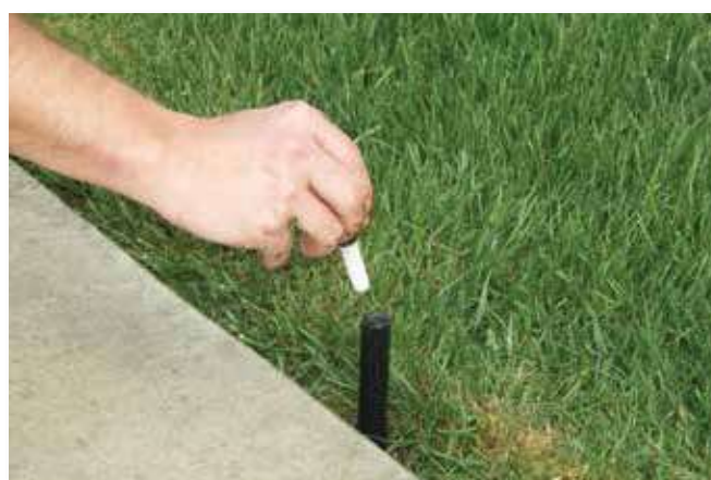
O 570ZXF permite instalações e trocas de bicos secos